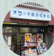
古本屋 オランダ屋書店