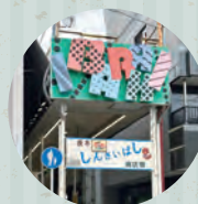
茨木しんさいばし