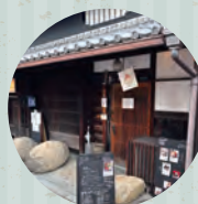
omo cafe + c