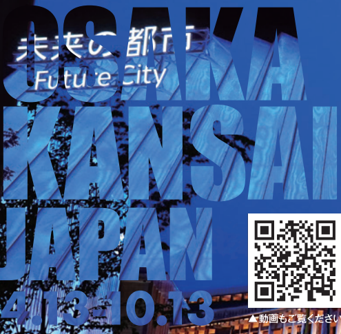
▲動画もご覧ください

2025年4月13日(日)にスタートした大阪・関西万博。開催がもう折り返しになりましたが、連日さまざまなイベントで、世界中の人々を魅了しています。暑い、暑いといいながら当社スタッフも見てきました、体験してきました。口々に「また行きた〜い!」と感動がまだ収まらないようです。では、その一部ショットをご紹介します。