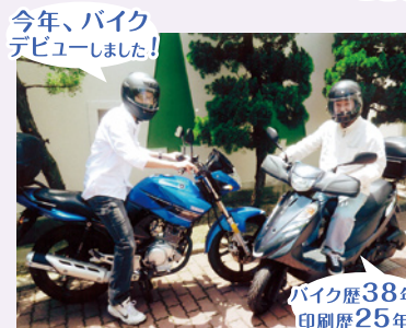
今年、バイクデビューしました!

住まいが八尾市の奈良県寄りということもあり、少し走るだけであつという間に自然がいっぱいの景色に変わります。