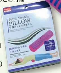
DAISO 骨盤ストレッチまくら

肩こりは職業病。特に年末からこの時期に掛けてはPCとにらめっこの時間 も長くなりバキバキ。座っている時間も長くなり腰にも痛みが。 そんな時はDAISOで見つけたコレがとてもいいです!夜寝る 前にテレビを見ながらリビングでゴロゴロ。横向きで腰を、縦向 きで背筋を伸ばします。肩甲骨が背中から剥がれる様な感じで、 30分もすればすごく楽に。ストレッチ効果で寝付きもよくなり朝 の目覚めもバッチリ。一石何鳥もの優れ物です。