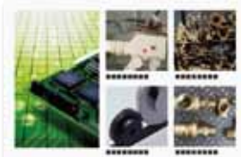
電機メーカー導入事例

パンフレットの基本は同じで、顧客にあわせ一部分だけを変えて印刷。得意先会社名の入替、ナンバリングも可能。大量に作るのではなく必要な時に必要な部数だけ印刷。だから常に新しい情報が提供できます。