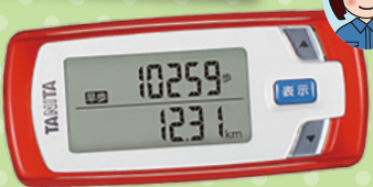
TANITA CALORISM EZ-062