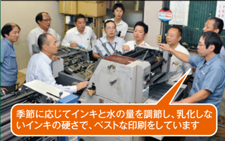
季節に応じてインキと水の量を調節し、乳化しないインキの硬さで、ベストな印刷をしています