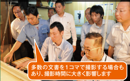
多数の文書を1コマで撮影する場合もあり、撮影時間に大きく影響します