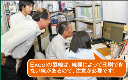
Excelの罫線は、線種によって印刷できない線があるので、注意が必要です!