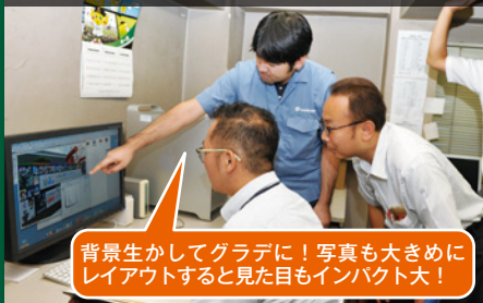
背景生かしてグラデに! 写真も大きめにレイアウトすると見た目もインパクト大!