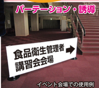
イベント会場での使用例