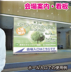
ホール入口での使用例