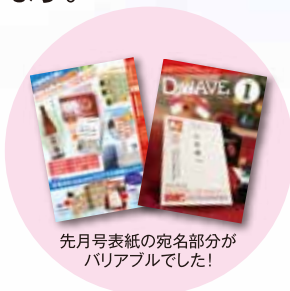
先月号表紙の宛名部分がバリアブルでした!

バリアブル印刷で対応した新年号のD-waveを「追加ください!」という営業や、4面の記事について「もう少し詳しく聞かせて!」というお客様のお声など、反響が大きかったので、今回はバリアブル印刷について事例をあげて説明いたします。