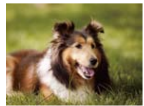
背景をぼかせば ほら、ワンちゃんもくっきり!

子供や自慢のペットを、可愛くきれいに撮りたい！ そんな時、背景をぼかして主役を引き立たせるという手法があります。 一眼レフデジタルカメラがあれば、その効果はより大きくなります。