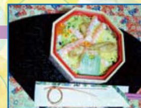
今月の写真：MAC室Mさんの3月3日の朝食

今月の用紙：多岐にわたって支持される訳はその絶対的な信頼感から。アイベストW(用紙厚：四六判12.5kg)